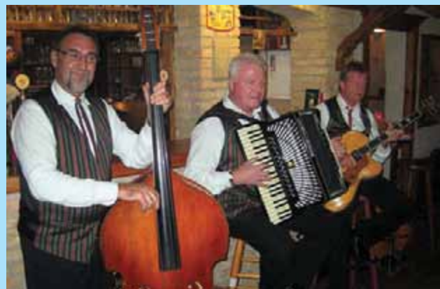
Lassen Sie sich beim LSC-Kirtag vom „Reblaus Trio“ am Samstag, 7. Juli, musikalisch verzaubern!